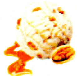
MAPLE WALNUT Enthält Nüsse