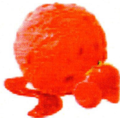
RASPBERRY & STRAWBERRY