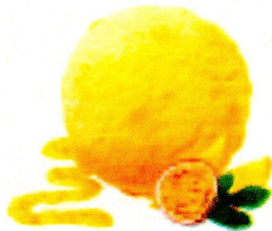
PASSION FRUIT & MANGO