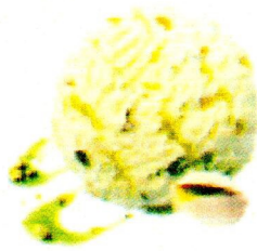
PISTACHIO Enthält Nüsse