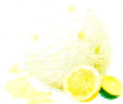
LEMON & LIME

"Questo è un dolce alla finezza del passato" - Die Prage der Nüsse. Beloved that natural ingredients would provide pleasant surprises. We believe that only natural ingredients create a delicious and premium ice cream experience.