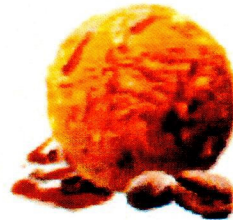
ESPRESSO CROQUANT Enthält Nüsse