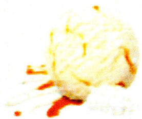
DOUBLE CRÈME & MERINGUES