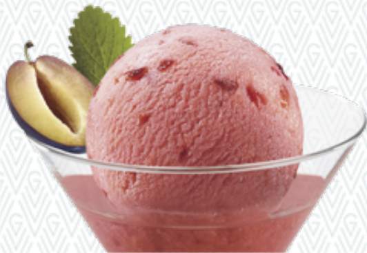
Sorbet Prunes Zwetschgen-Sorbet mit Vieille Prune CHF 11.00