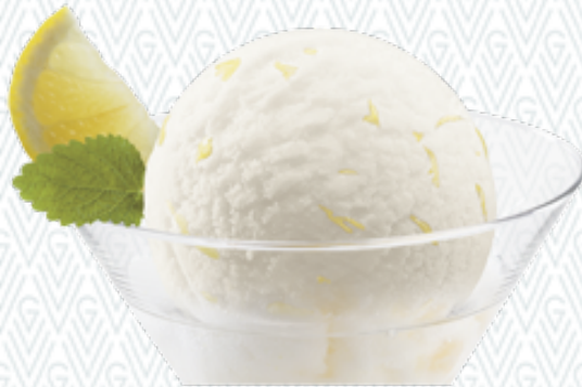
Sorbet Citron Zitronen-Sorbet mit Wodka CHF 11.00