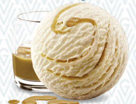
Irish Cream Rahmglace