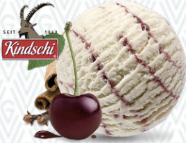
Röteli Kindschi Rahmglace