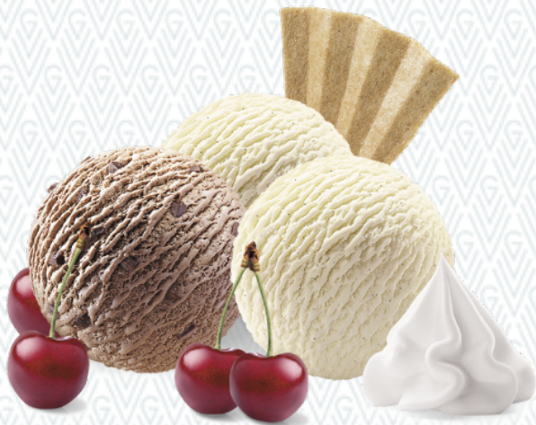
Coupe Schwarzwald Vanille- und Chocolat- Rahmglace mit Herzkirschen und Rahm CHF 11.00