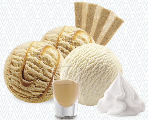
Coupe Irish Cream Irish Cream- und Vanille-Rahmglace mit Baileys und Rahm CHF 11.50