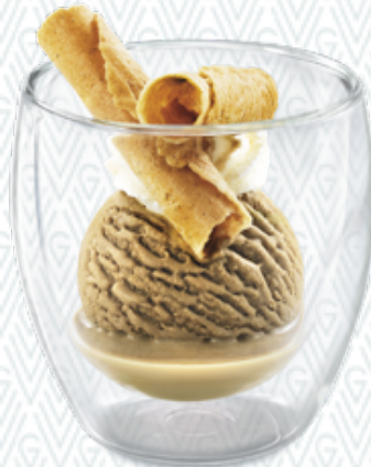
Baileys Café-Rahmglace, Baileys und Rahm CHF 7.00