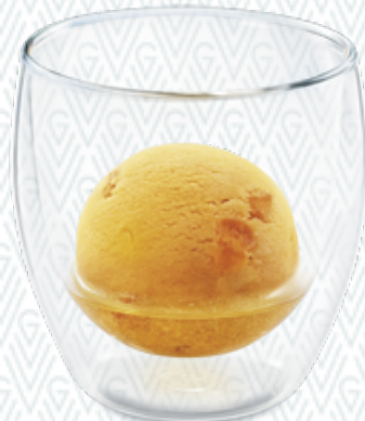
Abricotine Duett Aprikosen-Sorbet & Abricotine CHF 7.00