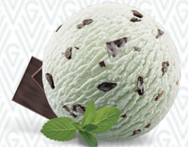
Menthe & Chocolat Rahmglace

Preis pro Kugel CHF 3.50 Rahmzuslag CHF 1.50