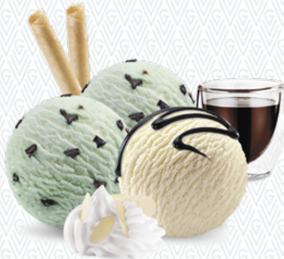
Coupe Sunset Menthe & Chocolat- und Vanille-Rahmglace mit Schokoladensauce und Rahm CHF 10.50