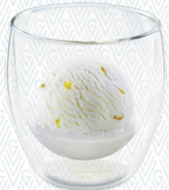
Colonel Fresh Zitronen-Sorbet & Vodka CHF 7.00