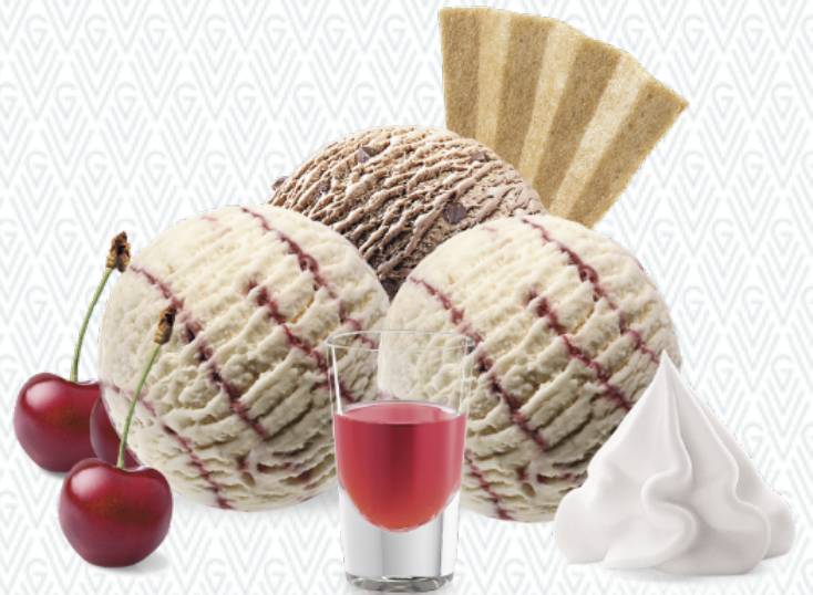
Schoggi Röteli Röteli- und Chocolat-Rahmglace mit Rahm CHF 11.50