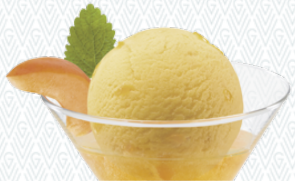
Sorbet Abricot Aprikosen-Sorbet mit Apricotine CHF 11.00