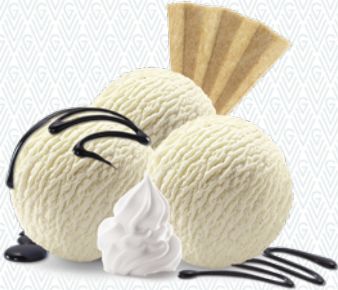
Coupe Dänemark Vanille-Rahmglace mit Schokoladensauce und Rahm CHF 11.00