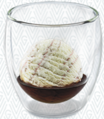
Röteli Duett Röteli-Rahmglace & Röteli CHF 7.00