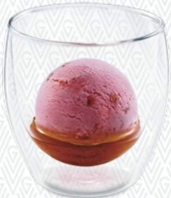
Vieille Prune Duett Zwetschgen-Sorbet & Vieille Prune CHF 7.00