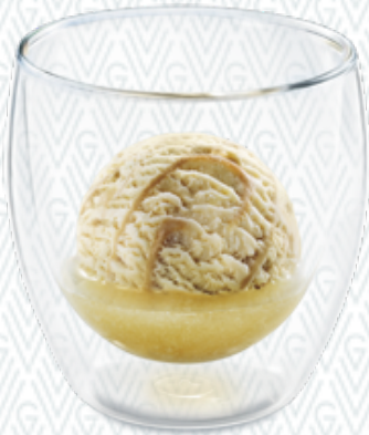
Whisky Royal Irish Cream-Rahmglace & Whisky CHF 7.00