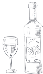
BEVANDE E VINO Karte