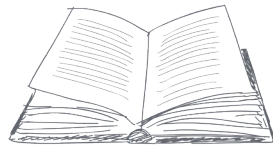
MENU English | Français