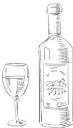
BEVANDE E VINO Karte