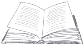
MENU English | Français