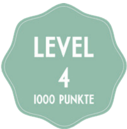
PIZZA O PASTA NACH WAHL