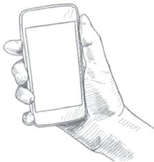
MOLINO ONLINE App | Loyalty Shop