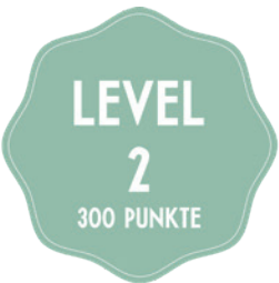
APERITIVO NACH WAHL