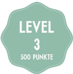
ANTIPASTO NACH WAHL