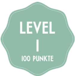
DOLCE NACH WAHL

Nehmen Sie an unserem Loyalty Programm teil und sammeln Sie fleissig Punkte. Come? Molino App runterladen, Kundenkonto erstellen und schon die erste Rechnung bei Ihrem Besuch im Molino über die App einscannen – Così semplice!