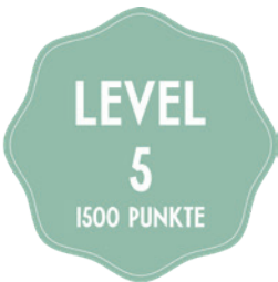
SECONDO NACH WAHL

Punkte können Sie vor Ort in unseren Pizzeria Ristoranti, über Take-Away oder Homedelivery sammeln.