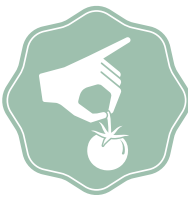
SELEZIONE Sorgfältig auserlesene Rezepte mit von uns selektionierten und hauseigenen Produkten