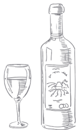
BEVANDE E VINO Karte