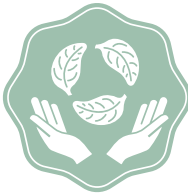
RESPONSABILITÀ Verantwortung und Nachhaltigkeit sind im Grundgedanken aller Mitarbeitenden verankert