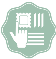
COME VUOI TU Nach eigenem Gusto und Wunsch kombinieren und geniessen