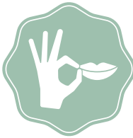
QUALITÀ Erstklassige Zutaten mit besonderem Augenmerk auf Herkunft und Zertifizierung