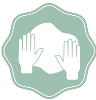
FATTO IN CASA Echtes Handwerk nach italienischer Tradition zu 100% vor Ort selbst gemacht

Bei Molino finden ausschliesslich frische, sorgfältig ausgewählte Zutaten den Weg auf Ihren Teller. Ein besonderes Augenmerk gilt der Herkunft unserer Produkte.