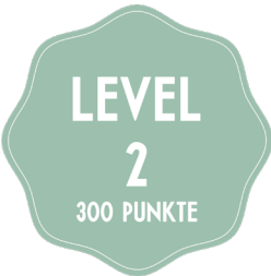
APERITIVO NACH WAHL