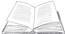
MENU English | Français