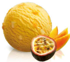
Sorbet Mango Passionsfrucht