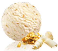
Chocolat Blanc Croquant