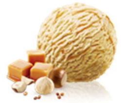
Noisettes Caramel Croquant