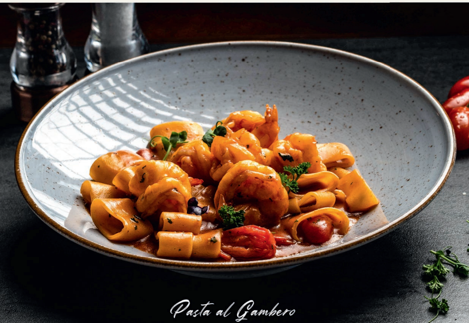
Pasta al Gambero