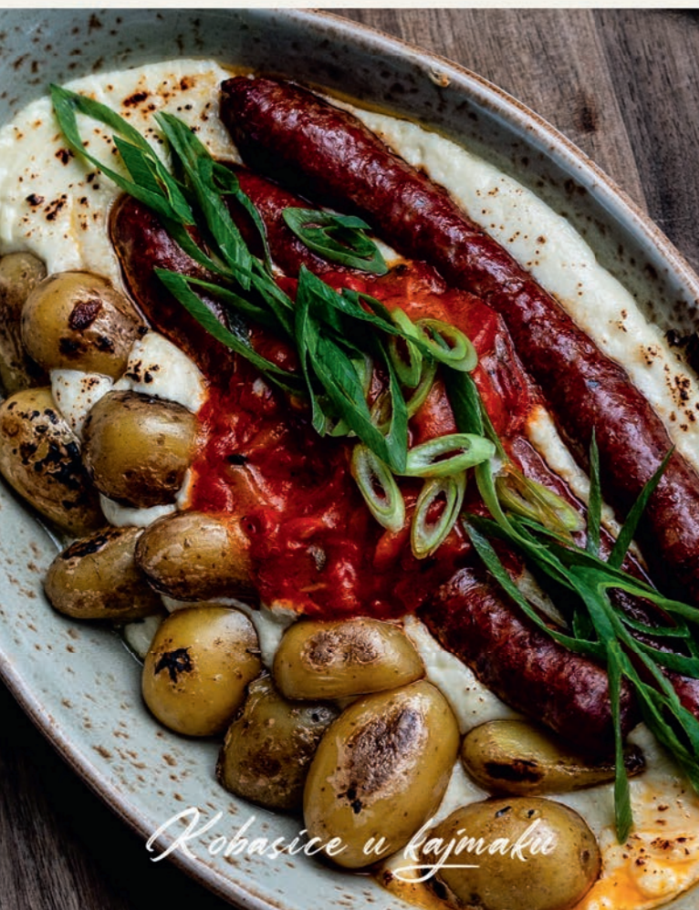
Kobasice u kajmaku