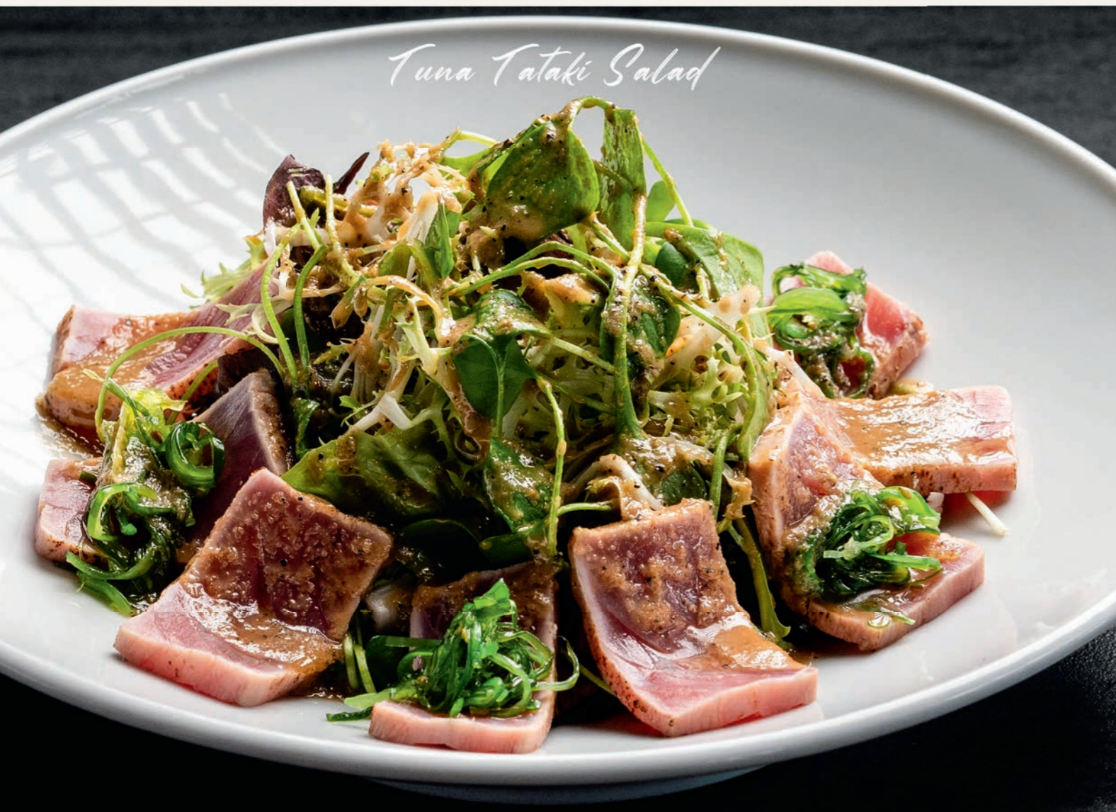
Tuna Tataki Salad