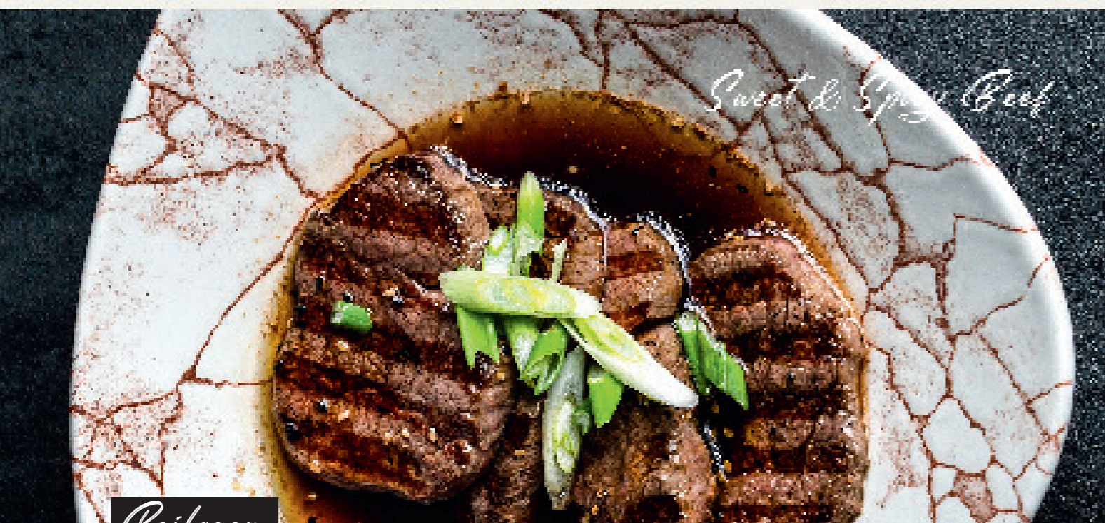
Sweet & Spicy Beef