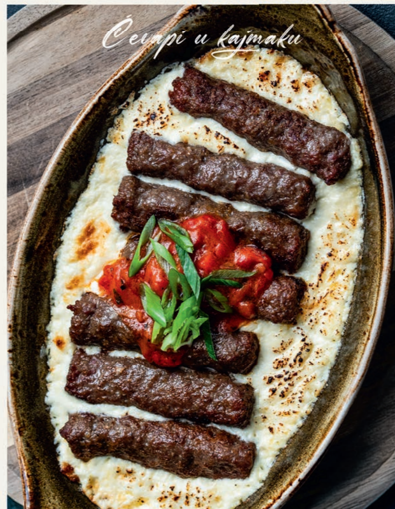
Ćevapi u kajmaku