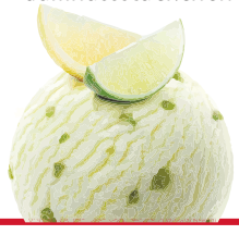
Lemon & Lime

Caramel Crème-glace mit Rahmcaramelstückchen