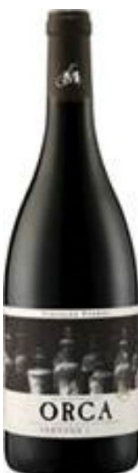
Gauch Cave des Rochers