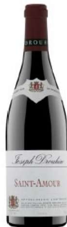
Henri Badoux SA