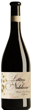
Henri Badoux SA

Passt zu: Gegrilltes, Käse, Risotto, Rotfleisch, Wild