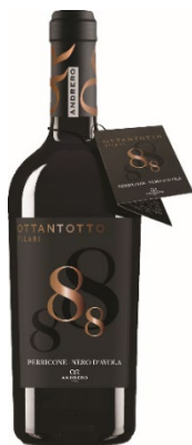
Cave de la Côte