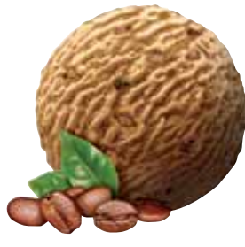
MOCCA* *ENTHÄLT HASELNUSSKROKANT