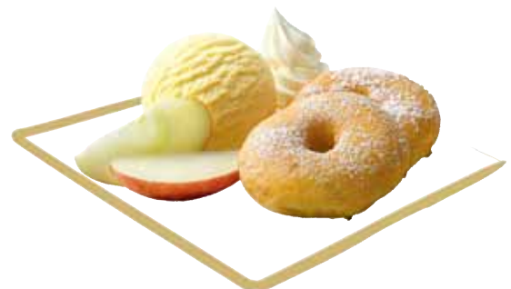
APFELCHÜECHLI mit Vanilleglace oder Vanillesauce