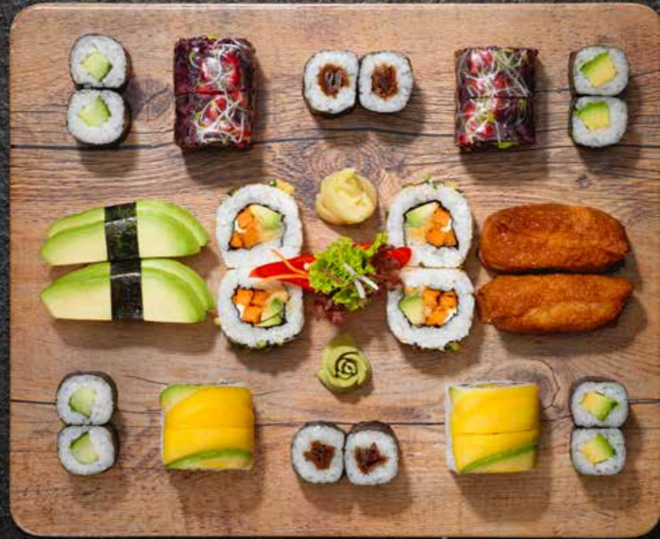
BEJITARIAN 🌿 (für 2 Pers.) Nigiri Guaca, Nigiri Inari, Rainbow Roll Mango, Levantin Roll, Miso Roll, Makis 48