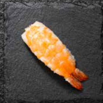
EBI NIGIRI Shrimp 4