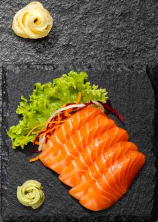
SASHIMI LACHS 13