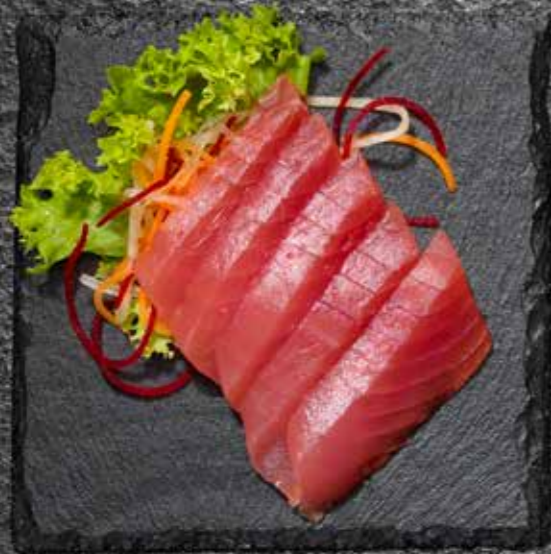
SASHIMI TUNA 14