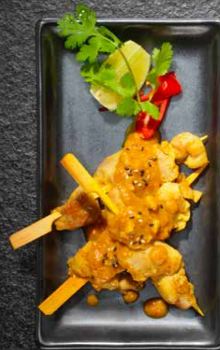
SATAY STICKS Marinierte Pouletspiessli mit Erdnusssauce 13.5