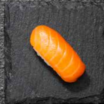
SHAKE NIGIRI Lachs 4