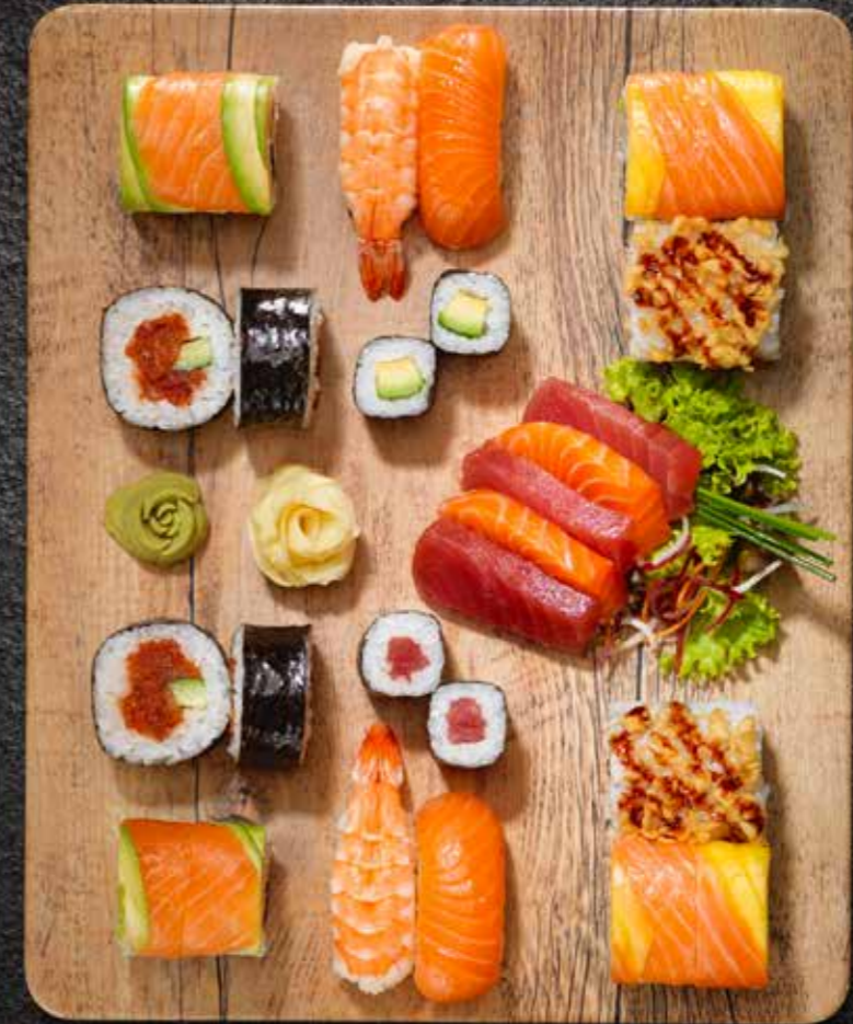
TOKYO STORY (für 2 Pers.) Lachs und Tuna Sashimi, Futomaki Spicy Tuna, Crunchy Prawn Roll, Rainbow Roll Salmon loves Mango, Rainbow Roll Lachs, Nigiri Shake, Nigiri Ebi, Makis 69