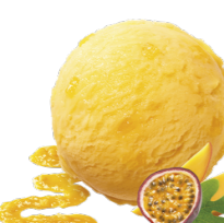
PASSION FRUIT & MANGO