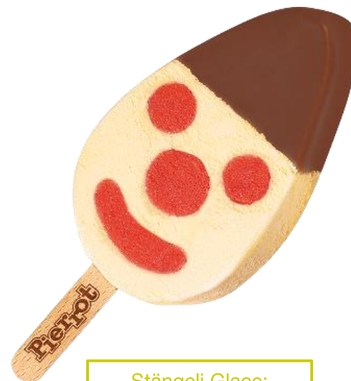
Stängeli Glace: Pierrot Tom 2.30