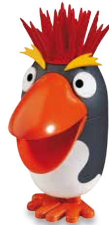
PUNKY Vanille-Glace CHF 6.80