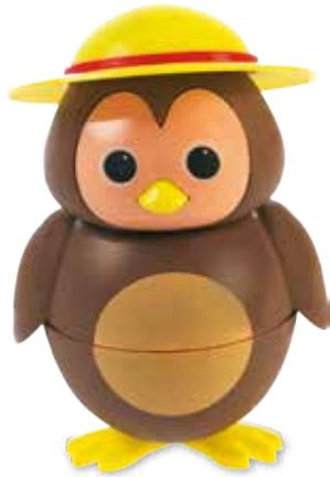
BIRDY Schokolade-Glace CHF 6.80