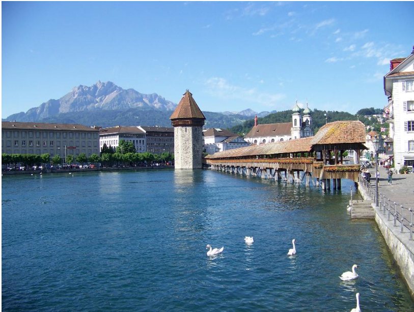
Kapellbrücke mit Wasserturm

Da die Stadt durch die Reuss geteilt wird, besitzt sie mehrere Brücken, welche die Altstadt mit der Neustadt verbinden. Die bekannteste davon ist die Kapellbrücke, die mit 170 m Länge zudem die älteste gedeckte Holzbrücke der Welt (1332) ist. Im Jahre 1993 zerstörte ein Feuer einen Grossteil der Brücke. Da diese in den 1960er Jahren umfassend renoviert und jedes einzelne hölzerne Bauteil registriert worden war, konnte sie nach dem Brand originalgetreu wieder aufgebaut werden. 81 von 111 der dreieckigen mittelalterlichen Originalgemälde, welche auf ihrer ganzen Länge im Giebel der Brücke angebracht waren, wurden beim Brand jedoch unrettbar zerstört. In der Mitte der Brücke befindet sich das Wahrzeichen von Luzern, der Wasserturm mit einem achteckigen Grundriss. Brücke wie Turm bildeten einen Teil der Stadtbefestigung. Deshalb sind auf der Seite des Wasserturms die Holzgeländer höher.