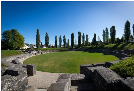
Amphitheater von Vindonissa

Während des Alpenfeldzugs von Kaiser Augustus im Jahr 15 v. Chr. errichteten römische Soldaten einen Militärposten, der später unter Kaiser Tiberius (14–37 n. Chr.) zu einem Legionslager ausgebaut wurde. Das Lager, 20 Hektar groß, wurde von der 13. Legion zunächst aus Holz und Lehm errichtet. Die 21. Legion baute es dann schrittweise in Stein um. Die 11. Legion zog im Jahr 101 n. Chr. unter Kaiser Trajan ab. Eine Zivilsiedlung entwickelte sich außerhalb des Lagers, blieb nach dem Abzug der Truppen bestehen. Die Legionäre spielten eine wichtige Rolle bei der Eroberung des rechtsrheinischen Gebiets und beim Aufbau der Strukturen in der südlichen Germania Superior. Vindonissa war politisch der bedeutendste Ort zwischen Alpen und Rhein, mit bis zu 6000 Legionären und Offizieren, die die mediterrane Lebensweise und die römische Kultur brachten und die Romanisierung vorantrieben.