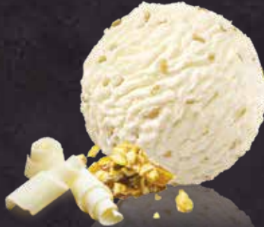
Chocolat Blanc Croquant