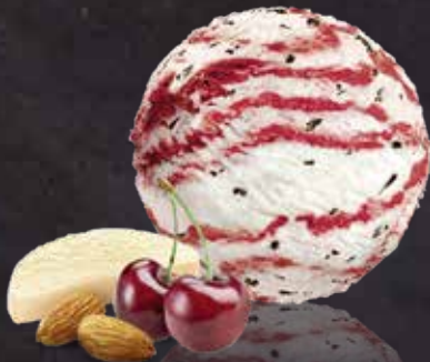
Marzipan - Sauerkirsche