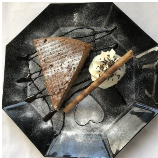
Saftiger Maronikuchen Fr. 8.50