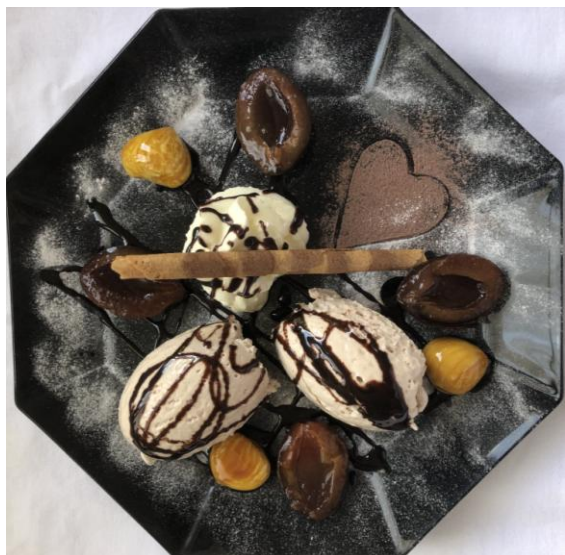
Marroni Mousse mit Zwetschgenkompott Fr. 8.50