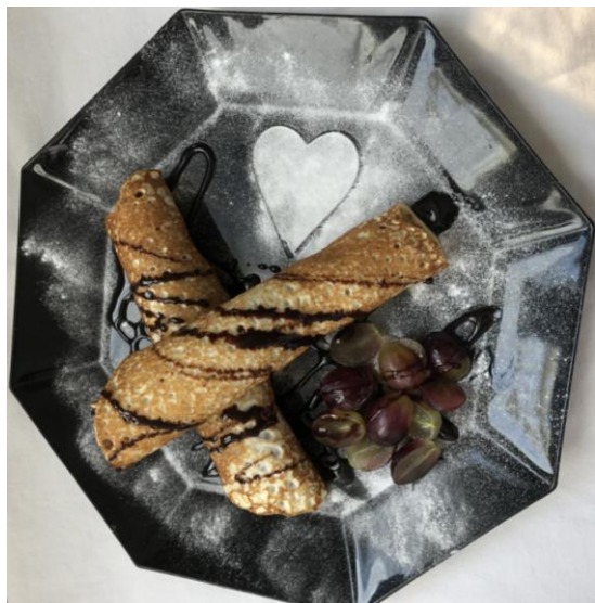
Kastanien-Schokoladen-Crêpes mit Rotweintrauben Fr. 8.50