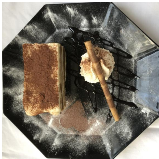
Hausgemacht Tiramisü Fr. 11.00